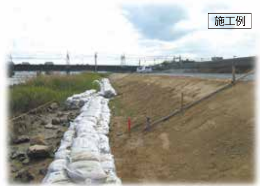
国土交通省 淀川河川事務所 福町地区堤防強化工事